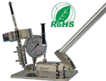
압출기가 달린 균질기