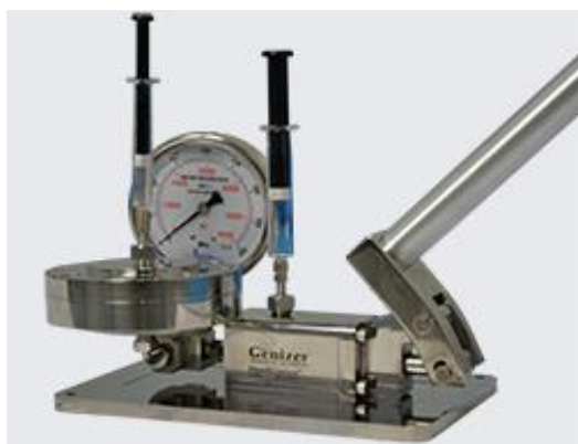
带脂质体挤出器的手动泵